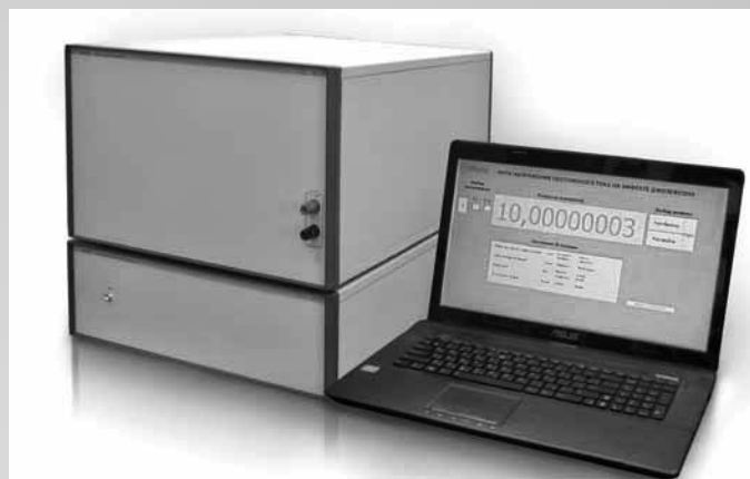
Рабочий образец прибора для эталонного измерения напряжения с встроенным криоохладителем замкнутого цикла

В 2013–2014 годах по заданию ОАО Федеральный научно-производственный центр «Нижегородский научно-исследовательский приборостроительный институт "Кварц" имени А.П. Горшкова» была