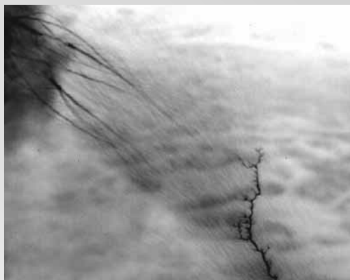
Отрицательно заряженное облако. Справа внизу – верхняя часть канала восходящего положительного лидера, стартовавшего от заземленного металлического шарика. Слева вверху – множество сталкеров в виде метлы. Лидер и сталкеры взаимодействуют посредством множества стримеров

На рисунке приведен один кадр ИК-камеры, на котором запечатлена находящаяся внутри облака верхняя часть канала положительного лидера, восходящего от заземленного металлического шарика, сеть сталкеров ближе к центру облака и слабосветящиеся потоки